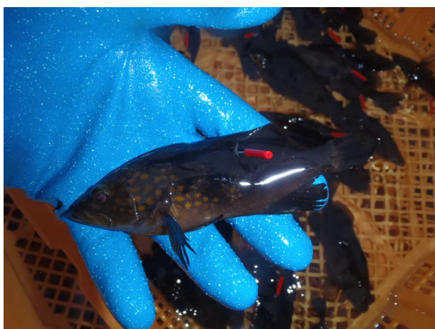
キジハタ 10 cm 一部に標識を付けて配布